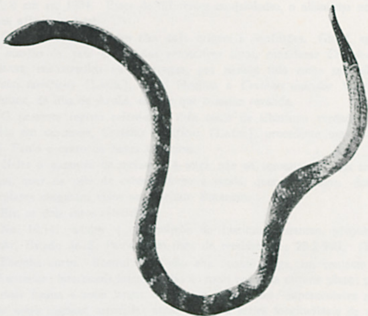
Atractus biseriatus , sp. n.