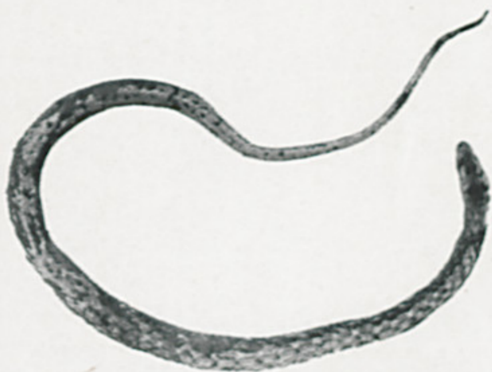
Dryophylax rutilus Prado, ♂ (face dorsal)