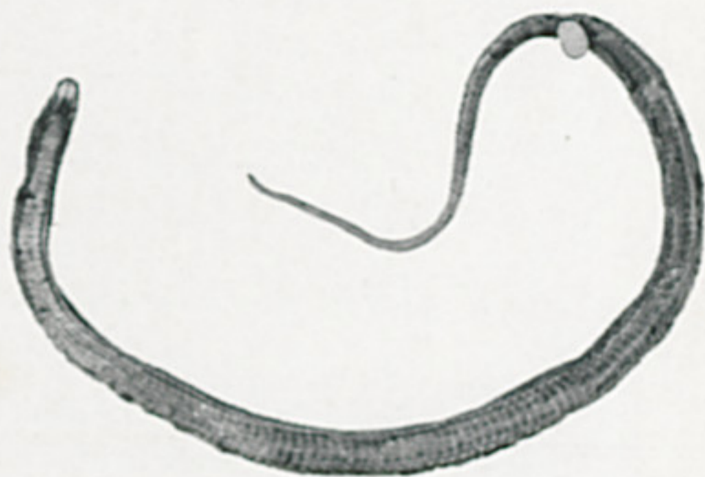
Dryophylax rutilus Prado, ♂ (face ventral)